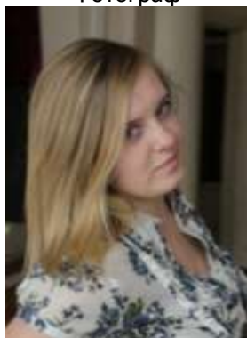
Галкина Владислава Фотограф