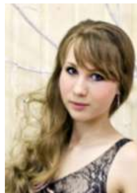
Юрченко Анна фотограф