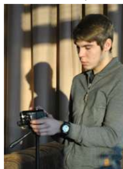
Косыгин Лев видео-, фотограф