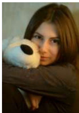
Проценко Анжелика фотограф