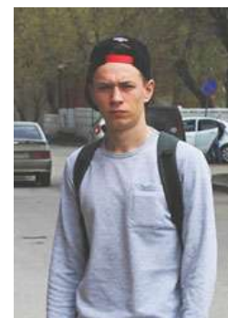
Руденко Алексей видео-, фотограф