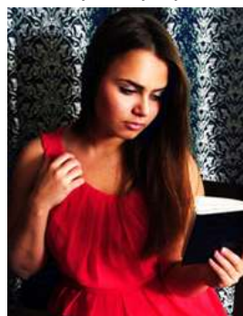
Храмова Надежда Фотограф