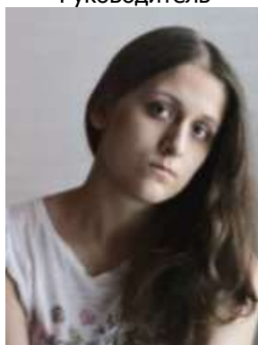
Горбунцова Карина фотограф