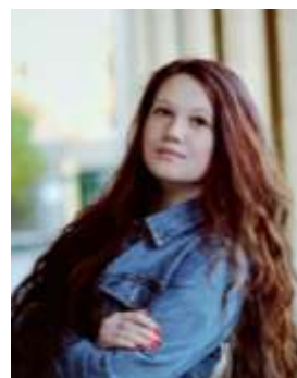
Мargarита Копылова Фотограф